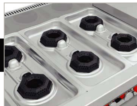
Cubiertas semi-selladas para evitar derrames al interior.