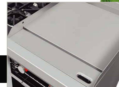
Plancha con exclusivo sistema para captar grasa y residuos.