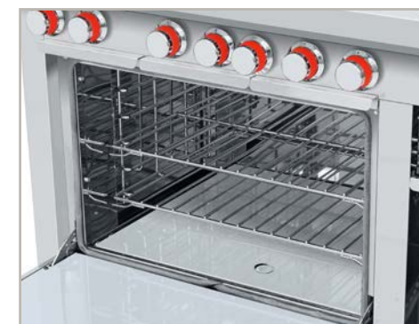
Horno mucho más productivo. ¡Puede hornear de todo! Pan, pasteles, aves, pescados, carnes, pasta, etc.