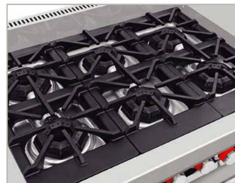
Robustas parrillas súper resistentes desmontables para facilitar la limpieza.